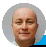
← Hernán Fonseca @lahoraoficial

Comunas desde Antofagasta a Magallanes, serán escenario de un nuevo acto democrático el próximo 9 de junio.