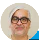
← Alejandro Villegas @lahoraoficial