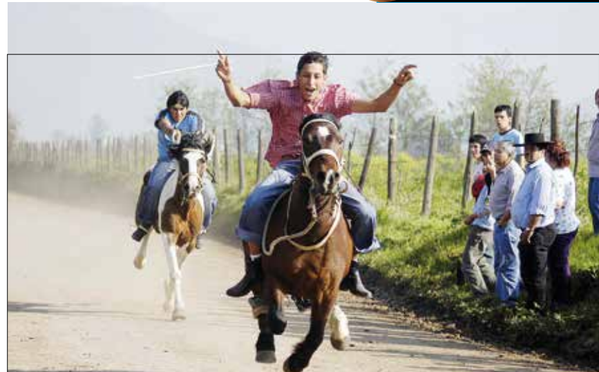
No es el Hipódromo ni el Club Hípico, sino una pista artesanal, donde la adrenalina reina en medio de una tradición criolla. Son las carreras a la chilena que se disputan en Lampa, y donde también las apuestas corren a la velocidad de los mismos caballos.