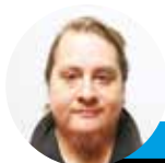
← Pedro Mendoza @lahoraoficial

El programa de espectáculos Sígueme de TV+ las juntó tras una enemistad de años por Iván Zamorano. Ahora parecieran ser inseparables. Enfrentaron el test de La Hora sin dejar escapar ninguna de las preguntas sobre su vida dentro del mundo de la farándula.