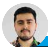
← Ignacio Duque @lahoraoficial

La Selección Chilena, en la disciplina de fútbol masculino, no está presente en la cita de los anillos desde Sydney 2000, donde se logró una histórica medalla de bronce.