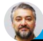
← Juan Pablo Carmona @lahoraoficial