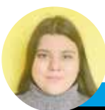
← Catalina Gamboa @lahoraoficial

La expectación parece flotar por los alrededores del Estadio Monumental. Mientras el primer equipo realiza su pretemporada en Uruguay, los dirigentes trabajan a toda velocidad para amarrar el fichaje de Arturo Vidal, considerado por muchos el mejor jugador en la historia de Chile.