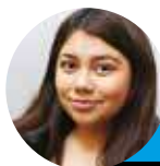
← Fernanda Gajardo @lahoraoficial

Ante el aumento de las audiencias televisivas que se produce a principios de año, los canales apuestan por captar la atención del público introduciendo una renovada programación dentro de sus parrillas.