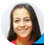
← María José Torres @lahoraoficial

A 38 días del término de 2023, los gastos suben y con ello la tentación a endeudarse. Es por esto que defensadeudores.cl entregan diversos consejos para aminorar estos problemas económicos con el fin de no desequilibrar la economía.