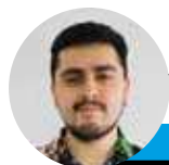
← Ignacio Duque @lahoraoficial

Cuando se habla de recambio de jugadores, la mayoría pensaría que es una cuestión más bien actual. Nada más lejano a la realidad. De eso se lleva hablando, por lo menos, 7 años, desde que la Generación Dorada perdió aquella final con Alemania en la Copa Confederaciones Rusia 2017.