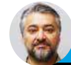
← Juan Pablo Carmona @lahoraoficial